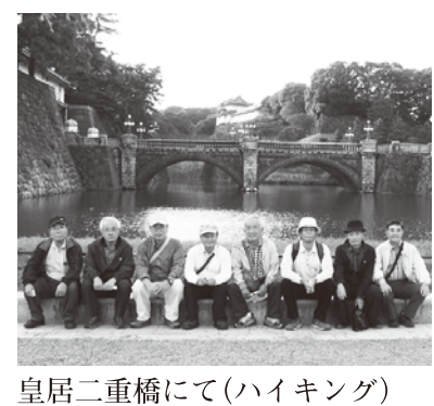
皇居二重橋にて(ハイキング)

関東周辺にお住まいの方、 同窓会にぜひおいで下さい。 楽しくやりましょう。 「仲間と会う、その時が青春！」 です。